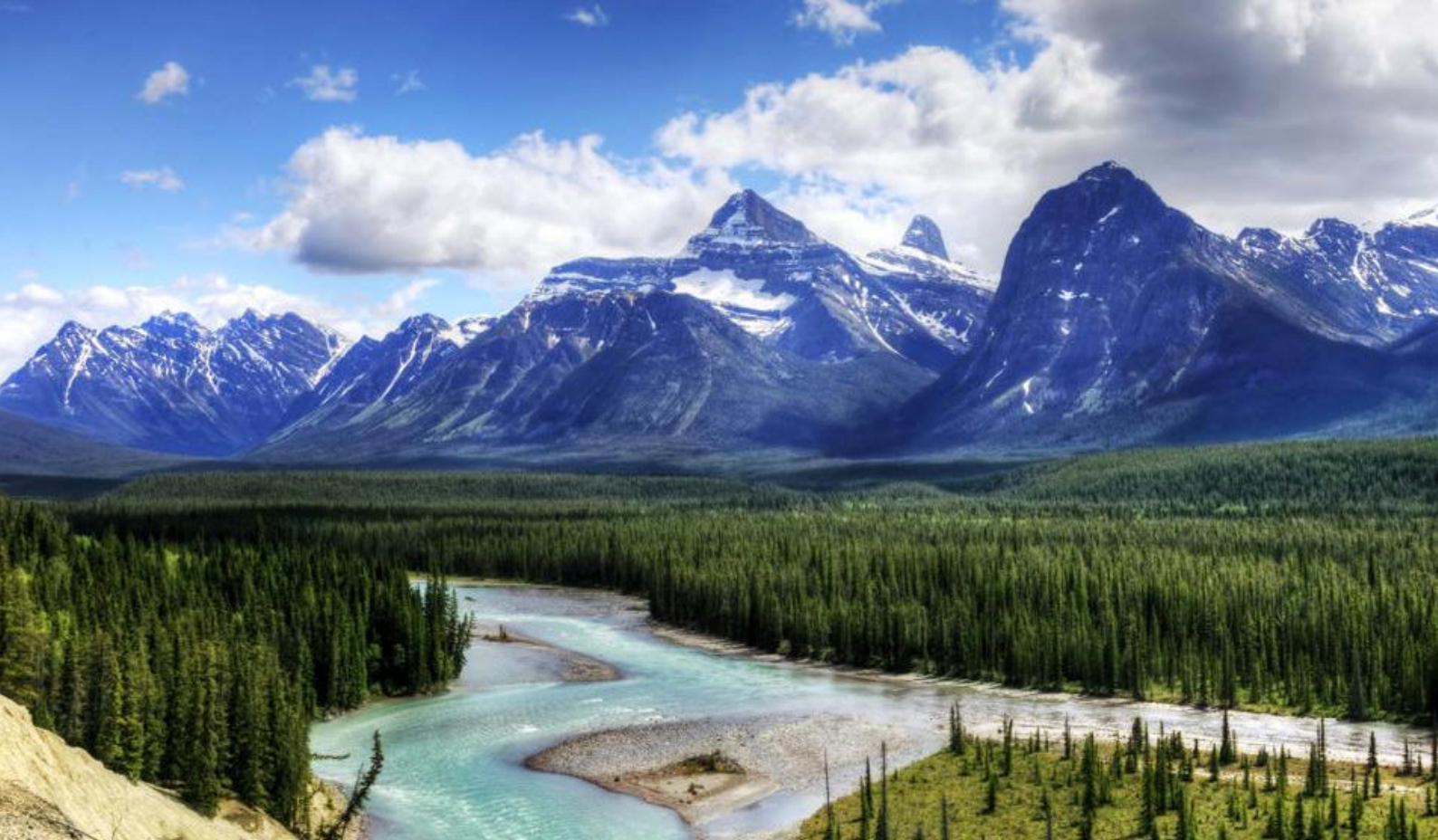
Jasper National Park, Alberta - Togreise i Canada

Opplev Vancouver på en hopp-på-hopp-av-tur med en trolleybuss (inkludert i prisen). Turer tar dere med til Gastown, English Bay, Granville Island og de fargerike totempælene i naturskjønne Stanley Park.