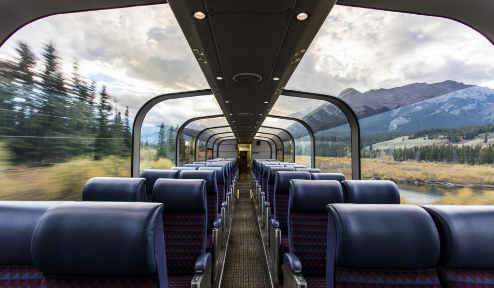
Panoramautsikt fra The Canadian.

Dere har hele dagen i dag til å slappe av og gå på oppdagelse i Jasper. Parken er en skarp kontrast til de høye Rocky Mountains, med sine åpne områder og fredfylte innsjøer.