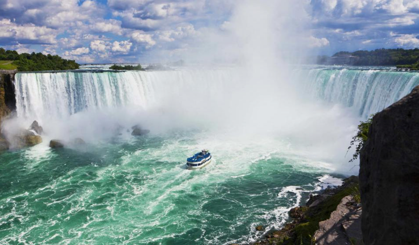
Niagarafallene i provinsen Ontario - Togreise i Canada