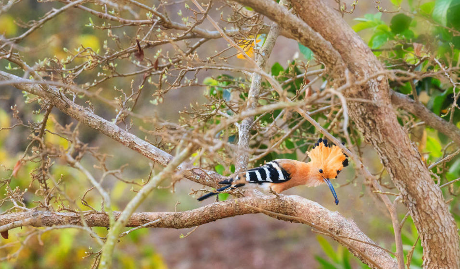
En Upapa som fanger insekter til sine unger, Isalo National Park

beste tidspunktene. Reservatet ble etablert i 1999 og er i dag Madagaskars mest populære økoturismedestinasjon. Det forvaltes av de lokale landsbyene.