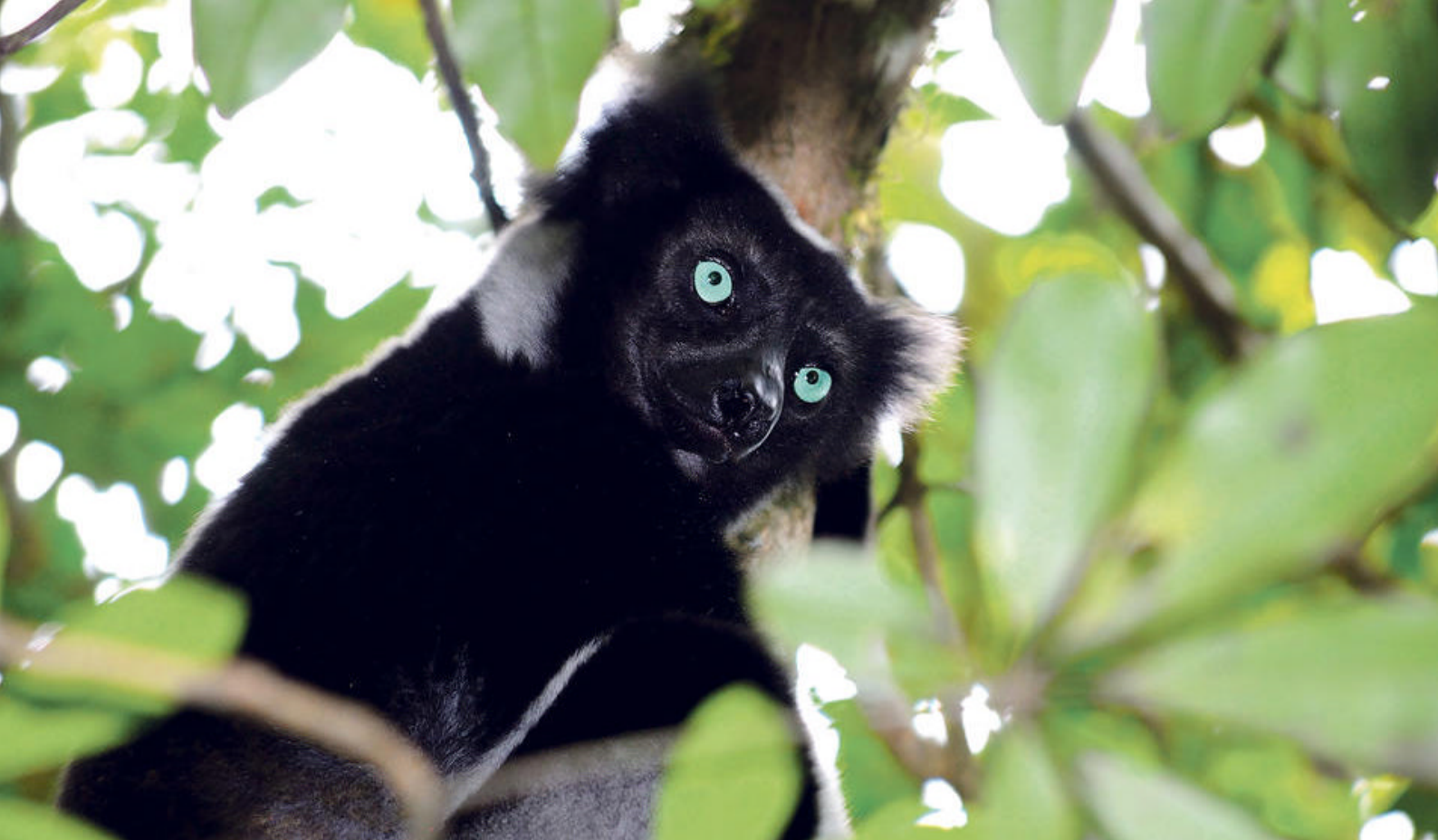
Den berømte Indri-lemuren på Madagaskar

seg over 60 hektar og er kjent for sine imponerende baobabtrær. I nærheten finner dere også et skildpaddereservat. Det er to ulike vandrestier, på henholdsvis 1,5 og 2,5 timers lengde, som gir dere muligheten til å utforske området nærmere.