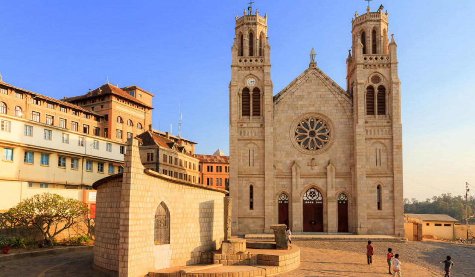
Den største katedralen, Andohalo, i Antananarivo, Madagaskar

kameloener og mer. Denne vandreturen varer omtrent tre timer og går langs stier som først går oppover, deretter flater ut.