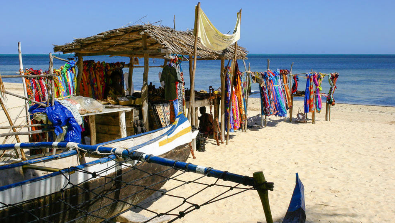
Souvenirbutikk på stranden, Ifaty