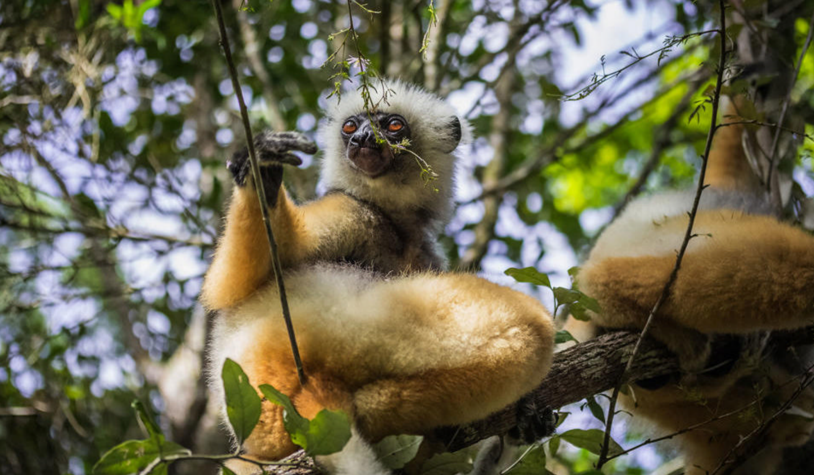
Sifakalemurer i trærne