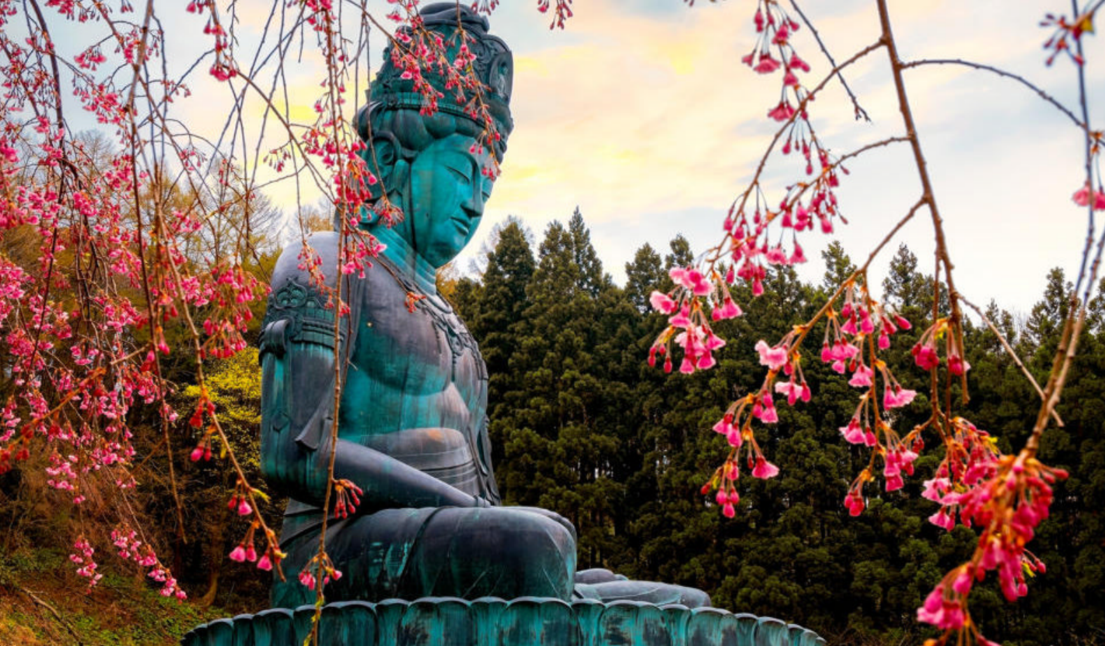
Aomori Great Buddha (Aomori Daibutsu) er en av de mest imponerende religiøse strukturene i Aomori-prefekturet i Japan

fantastiske showene om bord, det er morsomme spørrekonkurranser, bingo og andre spill, og det kan også være inspirerende foredrag og workshops.