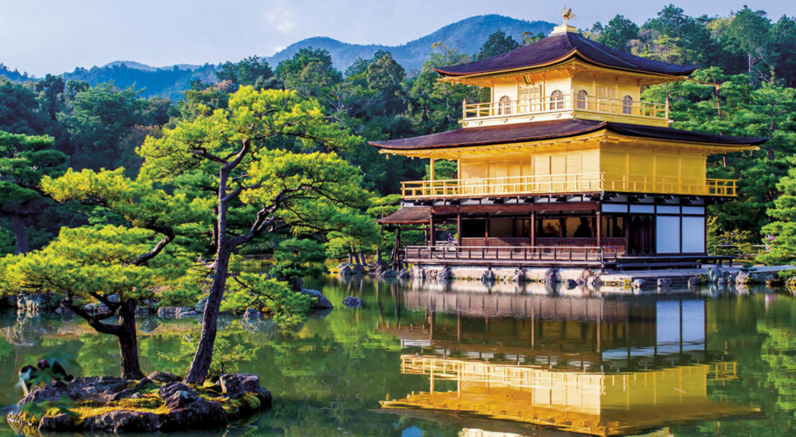
Det gylne tempel i Kyoto, som står på UNESCOs verdensarvliste

I bydelen Shizouka finner dere Kunozan Toshogu Shrine på Mt. Kunozan og som er det nest viktigste tempelet i hele Japan, etter Nikko-templene. For å komme hele veien opp til tempelet kan dere enten gå de 1000 trappetrinnene til toppen, eller ta kabelbanen fra Nihondaira-plataet.