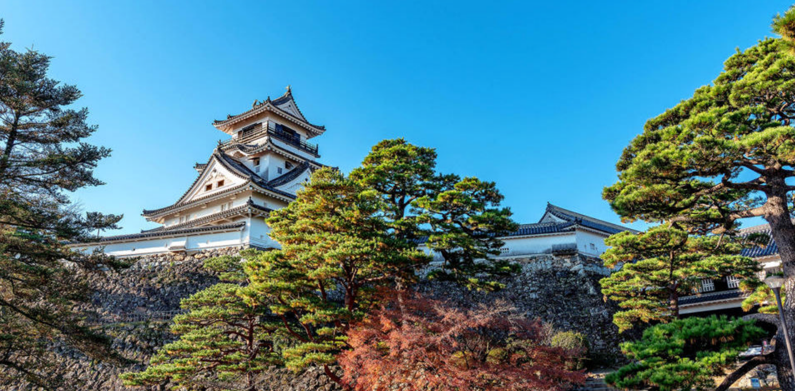
Se det vakre landskapet rundt det gamle slottet i Kochi