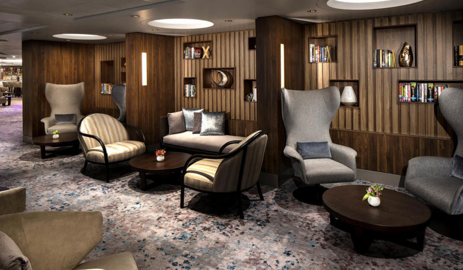
Nyt Rendezvous Lounge om bord, et elegant og stilfullt område der du kan slappe av og nyte en drink

Aomori er en by som ligger i den nordlige delen av Honshu og er hovedstaden i Aomori-prefekturet. Byen er kjent for sin naturskjønnhet, historiske steder og unike kultur.