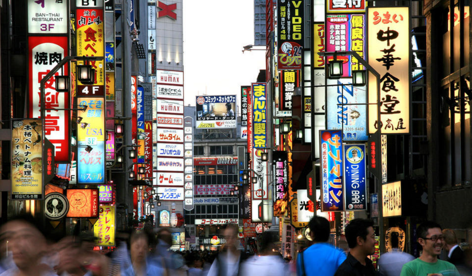
Det travle Shibuya-området i Tokyo

Harajuku fortsetter dere til Omotesando Street, også kjent som «Tokyos Champs-Élysées», en bred og elegant boulevard fylt med luksusbutikker og moderne arkitektur som gir området et stilig og internasjonalt preg.