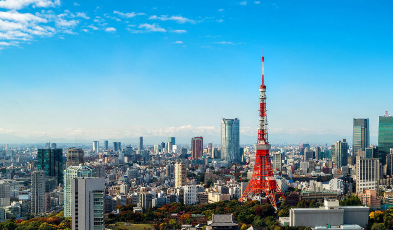
Et av Tokyos og Japans landemerker, det røde Tokyo Tower