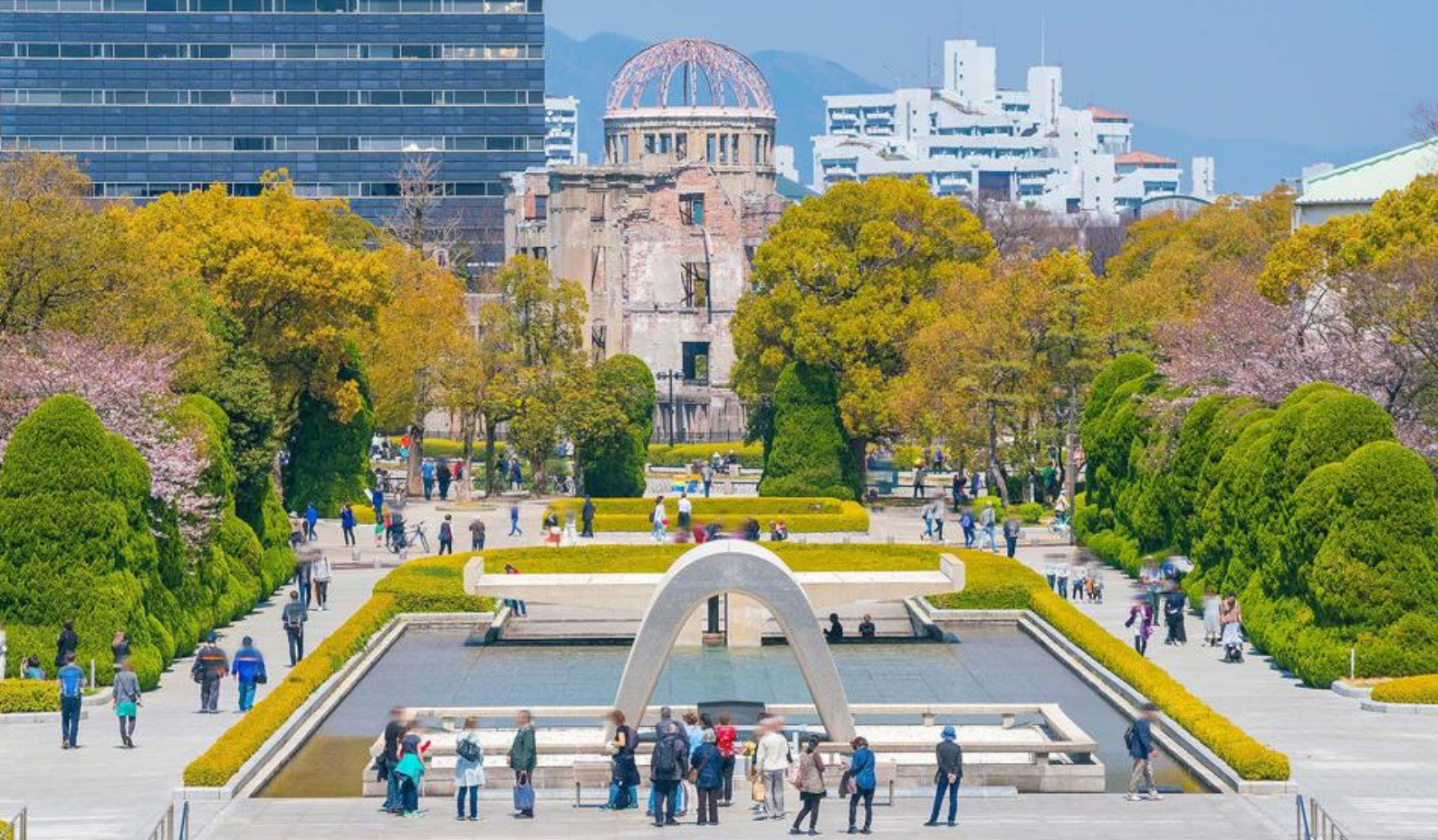
Hiroshima Peace Memorial er et av de symbolsk viktigste stedene i Hiroshima, og et sentralt minnesmerke for fred og gjenoppbygging etter andre verdenskrig

sluppet over byen og forårsaket massive ødeleggelser.