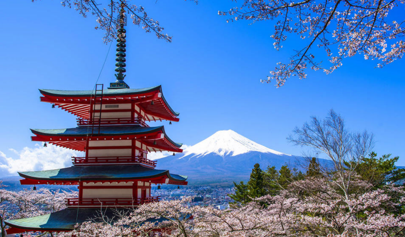
Fantastiske Mt. Fuji