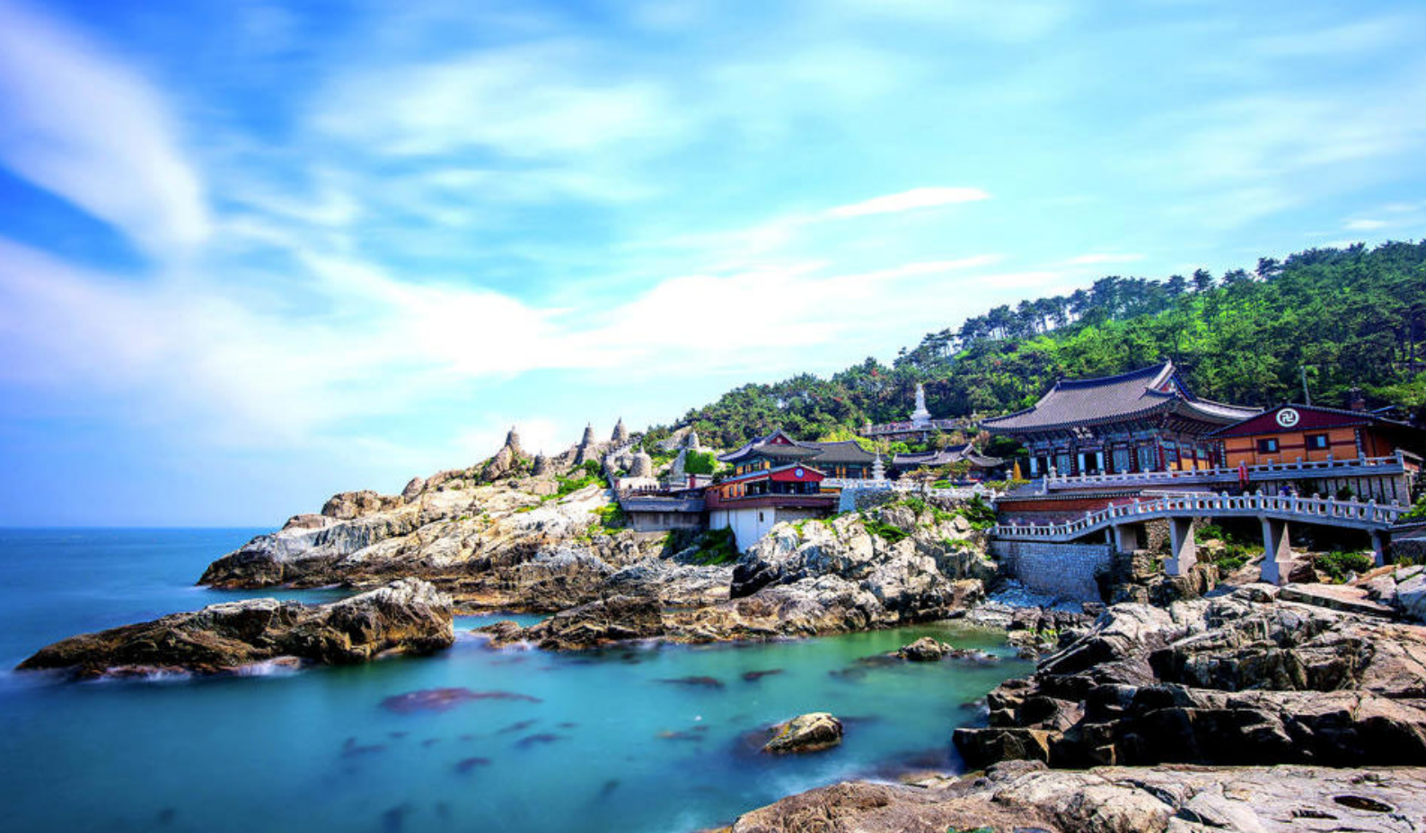
Fantastisk natur rundt Haedong Yonggungsa-tempelet i Busan

Det er en god idé å ta en titt på skipets aktivitetsprogram. Her finner dere en detaljert oversikt over de mange spennende aktivitetene og arrangementene som finner sted om bord.