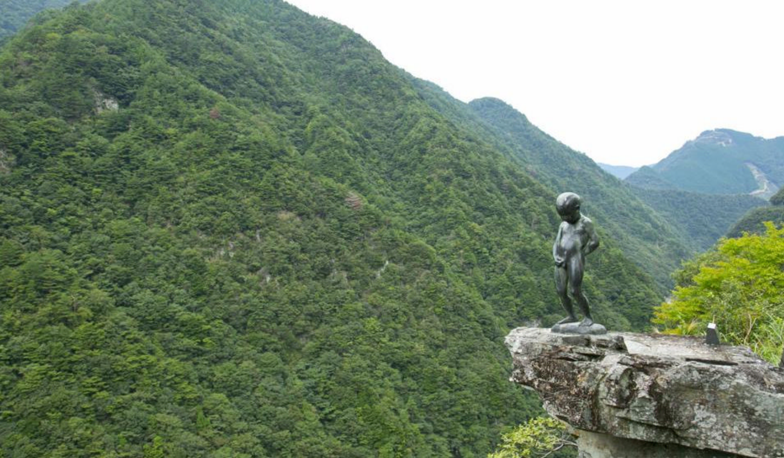
Iya Valley på Shikoku

århundrer, og helligdommen er kjent for sin fredfulle atmosfære og mange kulturelle og religiøse skatter. Dens lange tradisjoner og unike beliggenhet gjør den til et populært reisemål for både pilgrim�er og turister som ønsker å oppleve Japans åndelige arv.