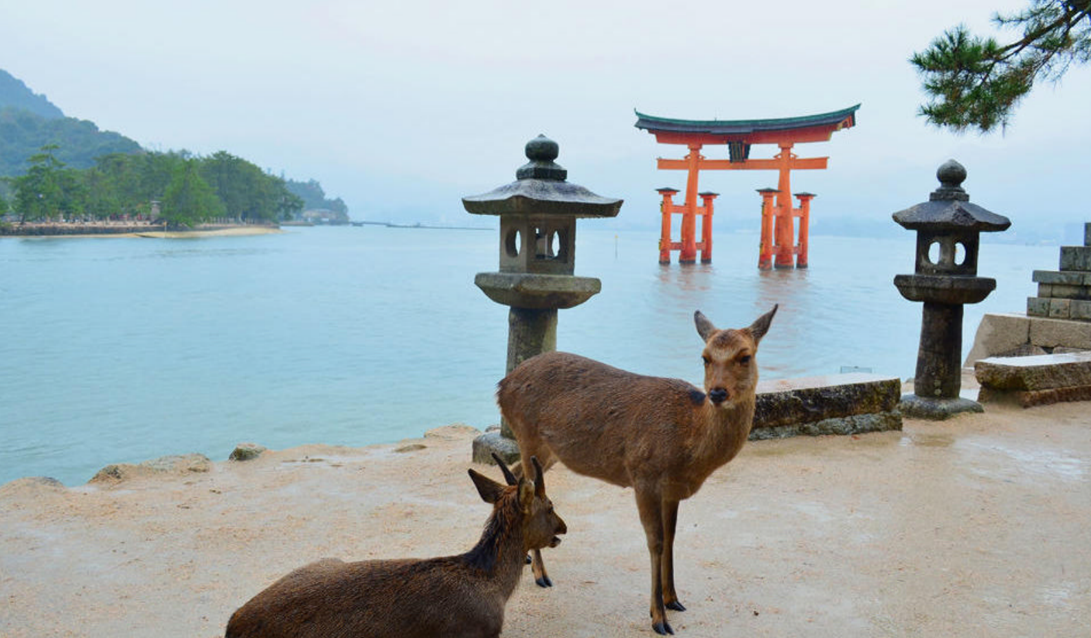
Torii-porten på Miyajima