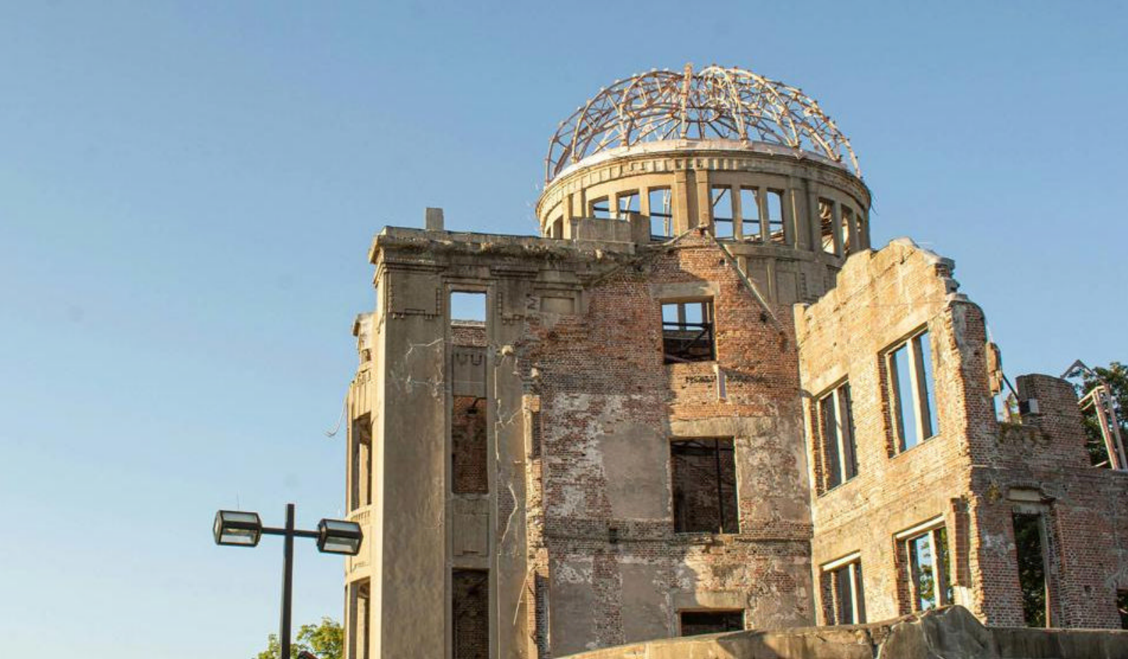
Atomic Bomb Dome i Hiroshima

for det imponerende Matsuyama-slottet, som troner på en høyde med utsikt over byen. Byen er også hjemsted for Dogo Onsen, en av Japans eldste og mest berømte varme kilder. Matsuyama byr på en blanding av tradisjonelle japanske opplevelser og moderne fasiliteter, noe som gjør byen til et populært reisemål for både kultur- og historieinteresserte.