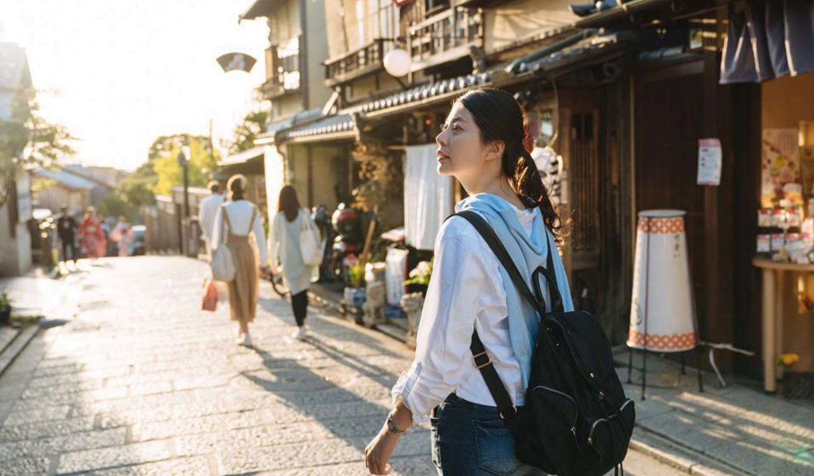
Ninen Zaka i Kyoto