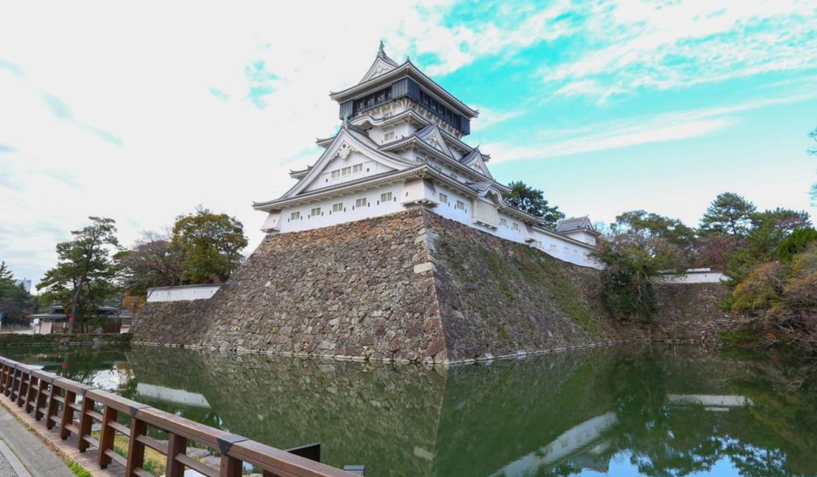
Katsuyama Castle på Shikoku

Udatsu-stil fra Edo-perioden. Udatsu-husene har karakteristiske utspring som strekker seg fra fasaden, støttet av dekorative bjelker. Dette gir bygningene et både elegant og funksjonelt design som reflekterer fortidens byggeskikk.