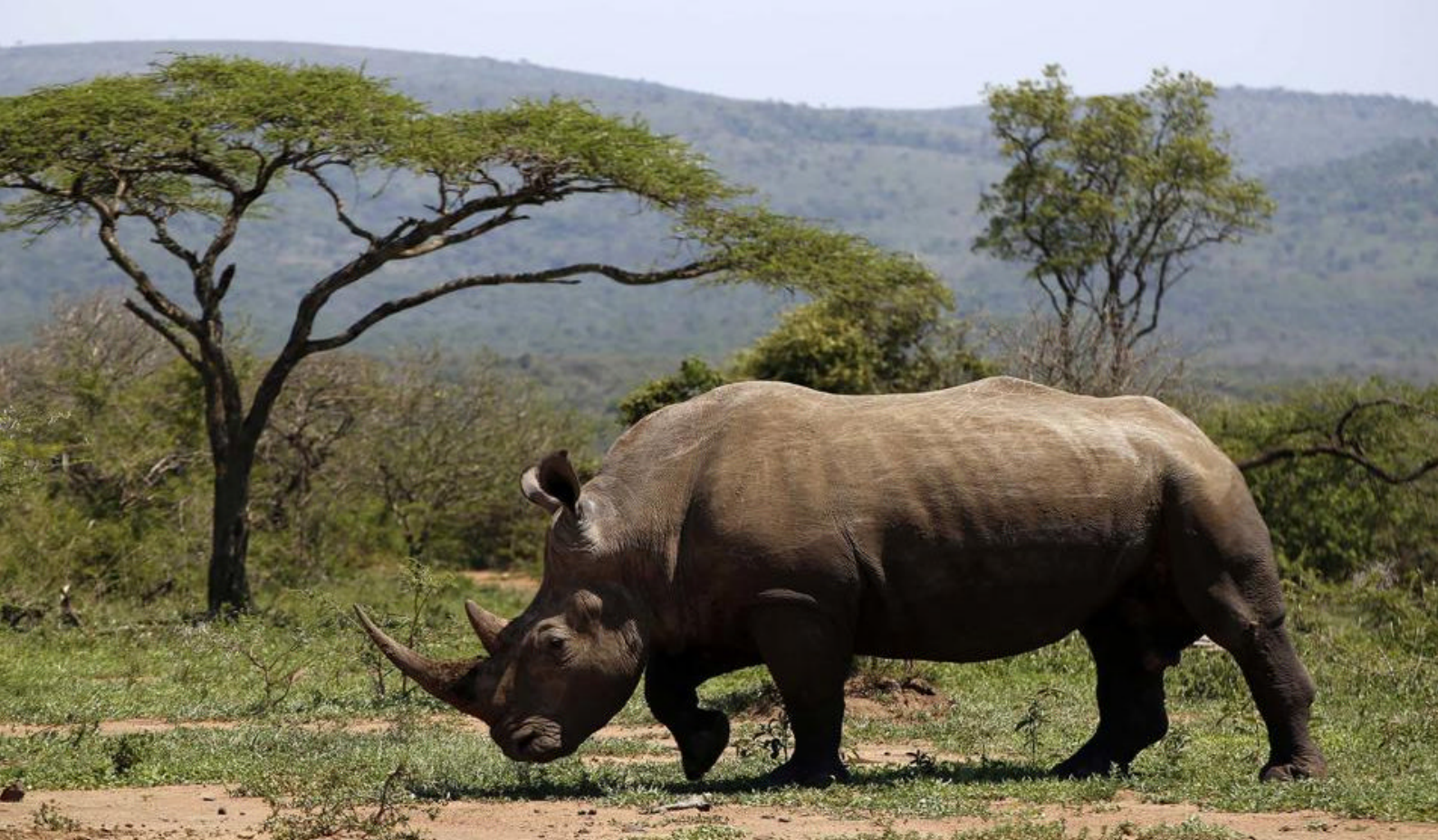
Neshorn i Krüger