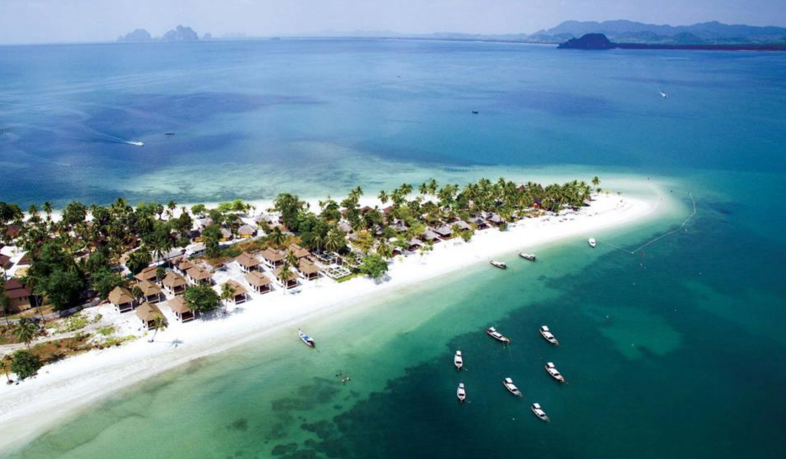
Sivalai Beach Resort på Koh Mook