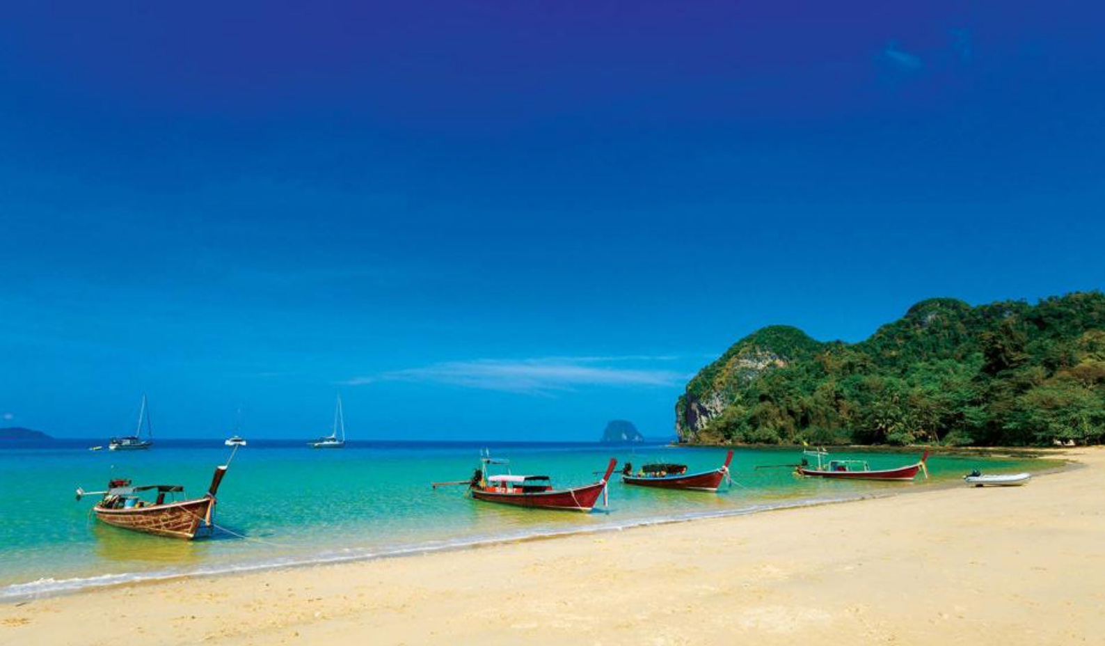
Langhalebåter på Koh Mook

fortsetter dere reisen med en rask passasjerbåt til Koh Ngai, hvor dere skal tilbringe de neste 5 nettene på Sivalai Beach Resort.