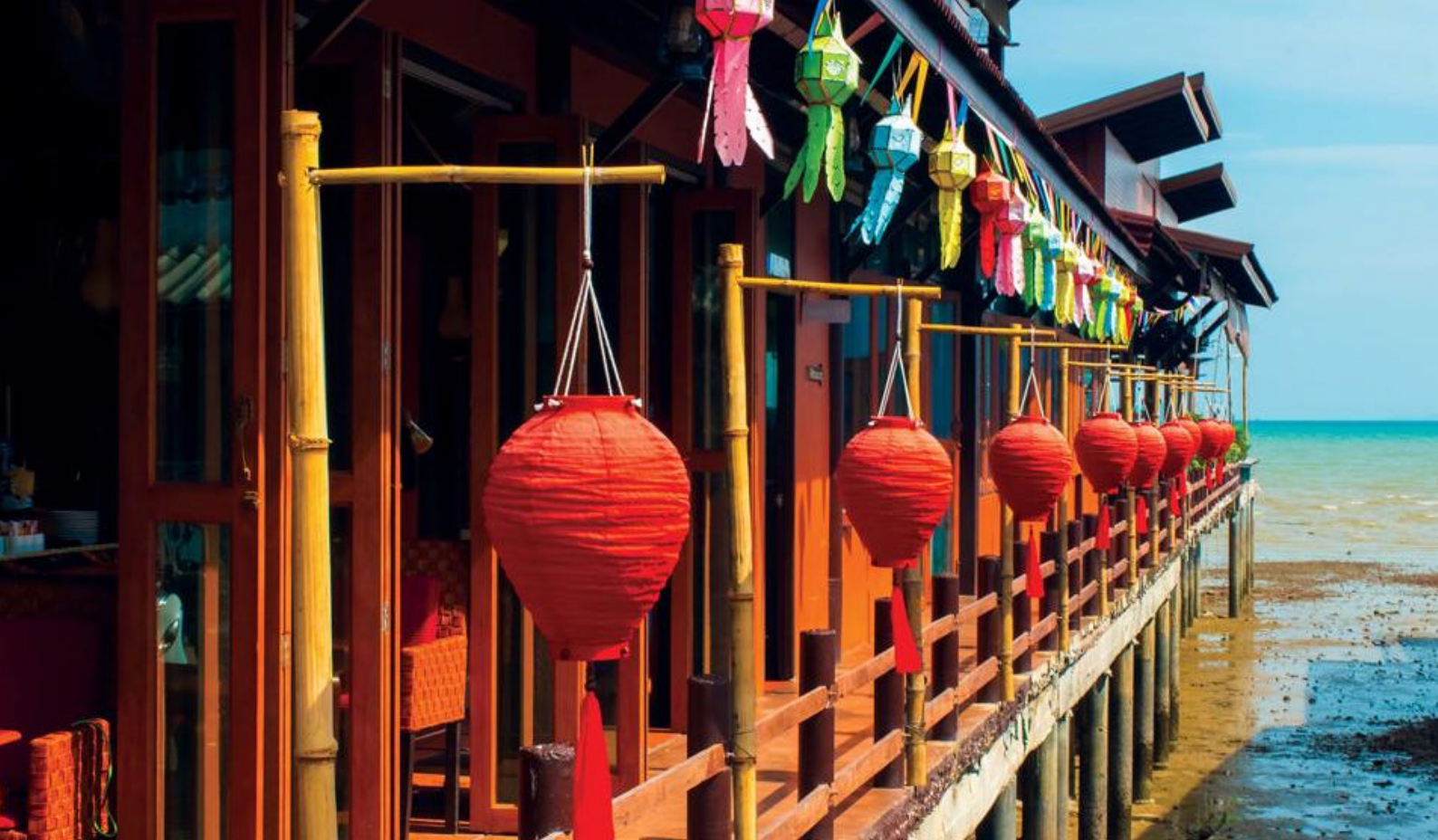
Koh Lanta Old Town