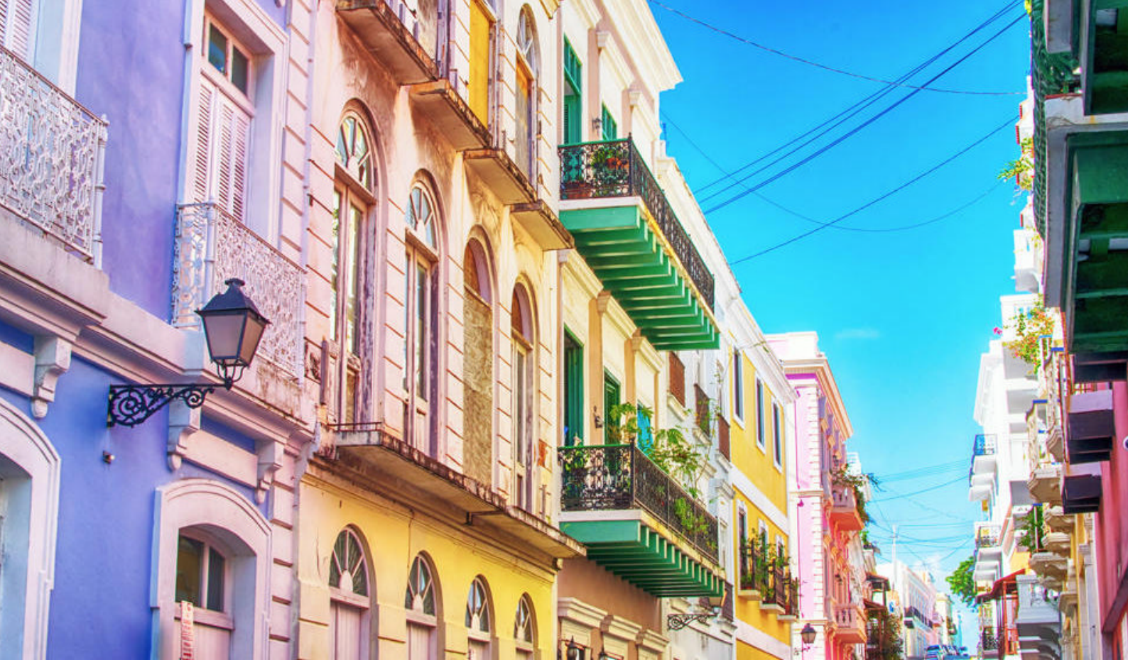
Utforsk Old San Juan