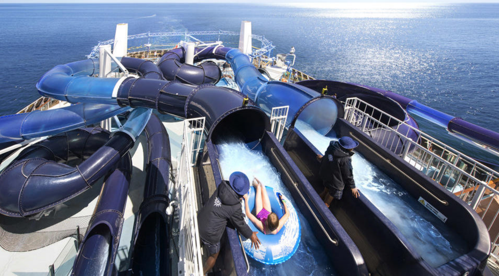
MSC Meraviglia er full av aktiviteter for dager til sjøs

Onsdag: Cozumel, Mexico Torsdag: Isla de Roatan, Honduras Fredag: Til sjøs Lørdag: Ocean Cay MSC Marine Preserve, Bahamas Søndag: Miami, Florida