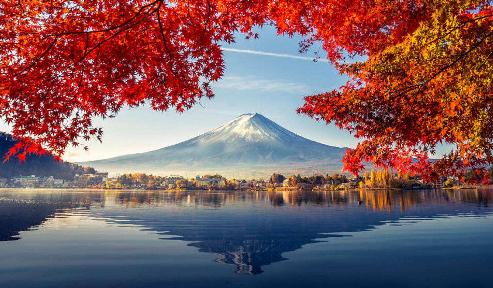
Mt. Fuji, Japan

da den har hele 11 hoder. Minst like imponerende er Kotoku-in Temples Great Buddha of Kamakura - en 11,4 meter høy og 121 tonn tung Buddha-statue laget i kobber.