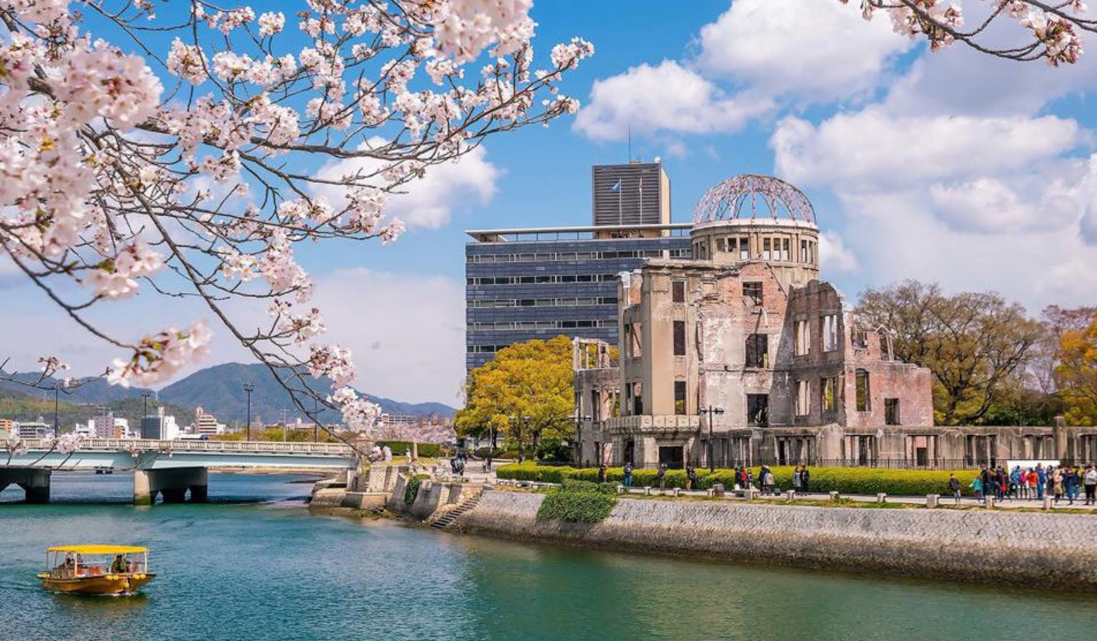
Kirsebærtrærne blomstrer utenfor Hiroshima Peace Memorial

fantastisk utsikt, hvor man på klare dager kan se berømte landemerker som Mt. Fuji, Tokyo Skytree og Meiji Shrine.