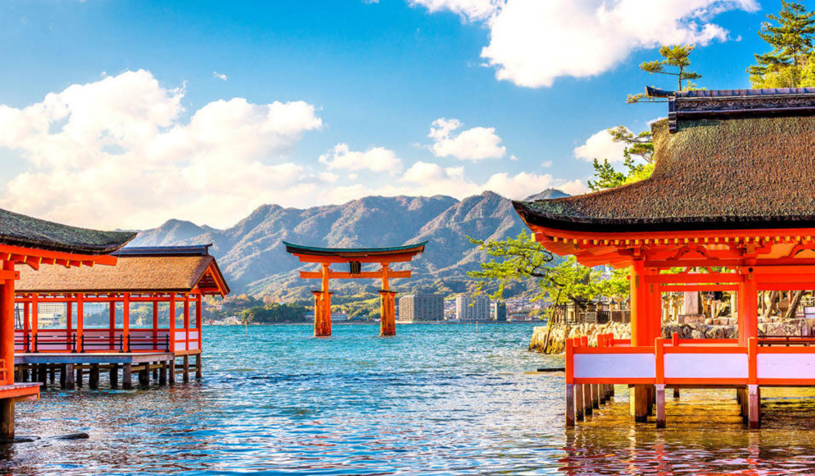
Itsukushima-helligdommen og den ikoniske "flytende" torii-porten på Miyajima-øya utenfor Hiroshima