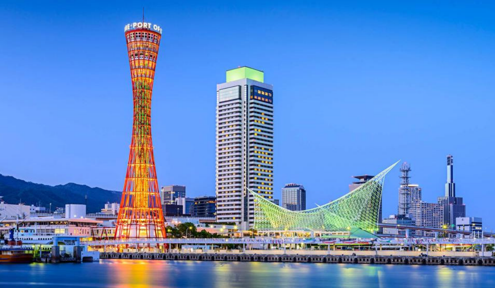
Skylinen i byen K? be med det ikoniske røde landemerket, K? be Port Tower

anlagt som en kunstig øy for å isolere først portugiserne og senere en nederlandsk handelsstasjon fra den japanske befolkningen. Inntil 1859 var Dejima det eneste stedet i Japan hvor den vestlige verden hadde adgang. I dag er øya blitt gjenforent med fastlandet, men det er fortsatt mulig å utforske øyas historiske bygninger.