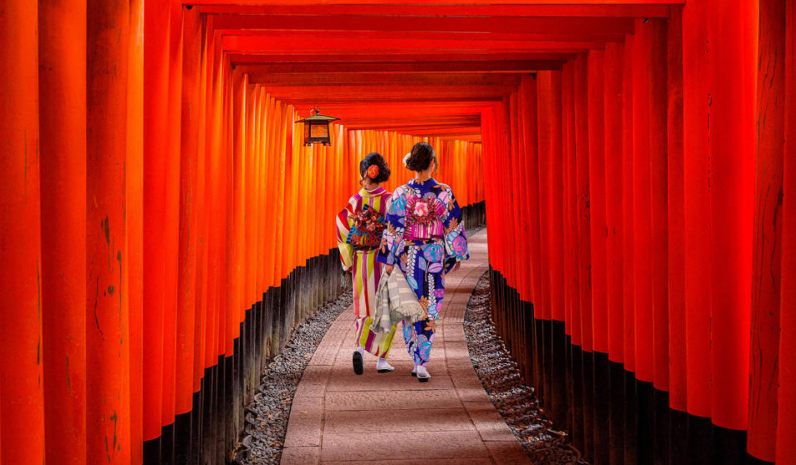
Flott Torii-port i Kyoto i røde omgivelser