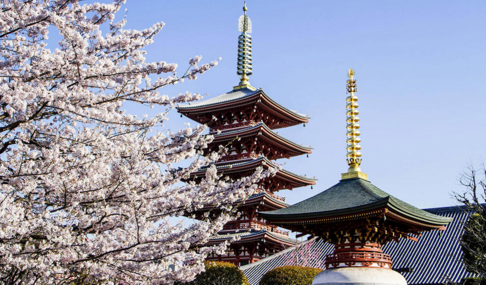
Kannon Temple i Asakusa i Tokyo, Japan

Temple og Kinkaku-ji Temple. Begge templene er utrolig vakre. Fra Kiyomizu får dere et helt fantastisk syn over byen, hvor gulltemplet, Kinkaku-ji templet, pryder øyet med et fantastisk speilbilde i innsjøen som ligger i forkant.