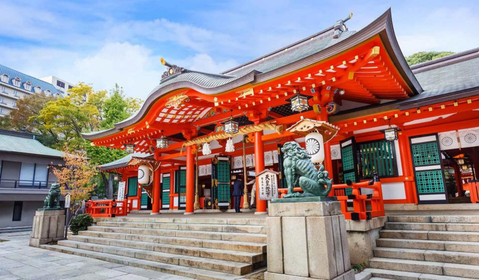
Ikuta-helligdommen i Kobe, angivelig en av Japans eldste shinto-helligdommer