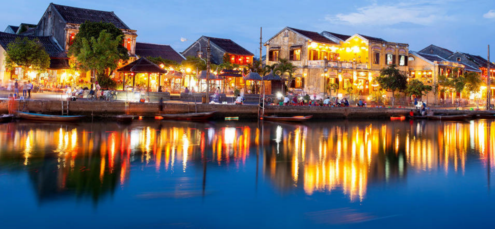
Fiskebyen Hoi An, Vietnam

Nha Trangs største attraksjon er den lange, nydelige stranden med utsikt over det dype blå havet og de mange øyene utenfor byen. Her er det et livlig strandliv med mange koselige barer og restauranter, og det er rikelig med muligheter for ulike vannaktiviteter.