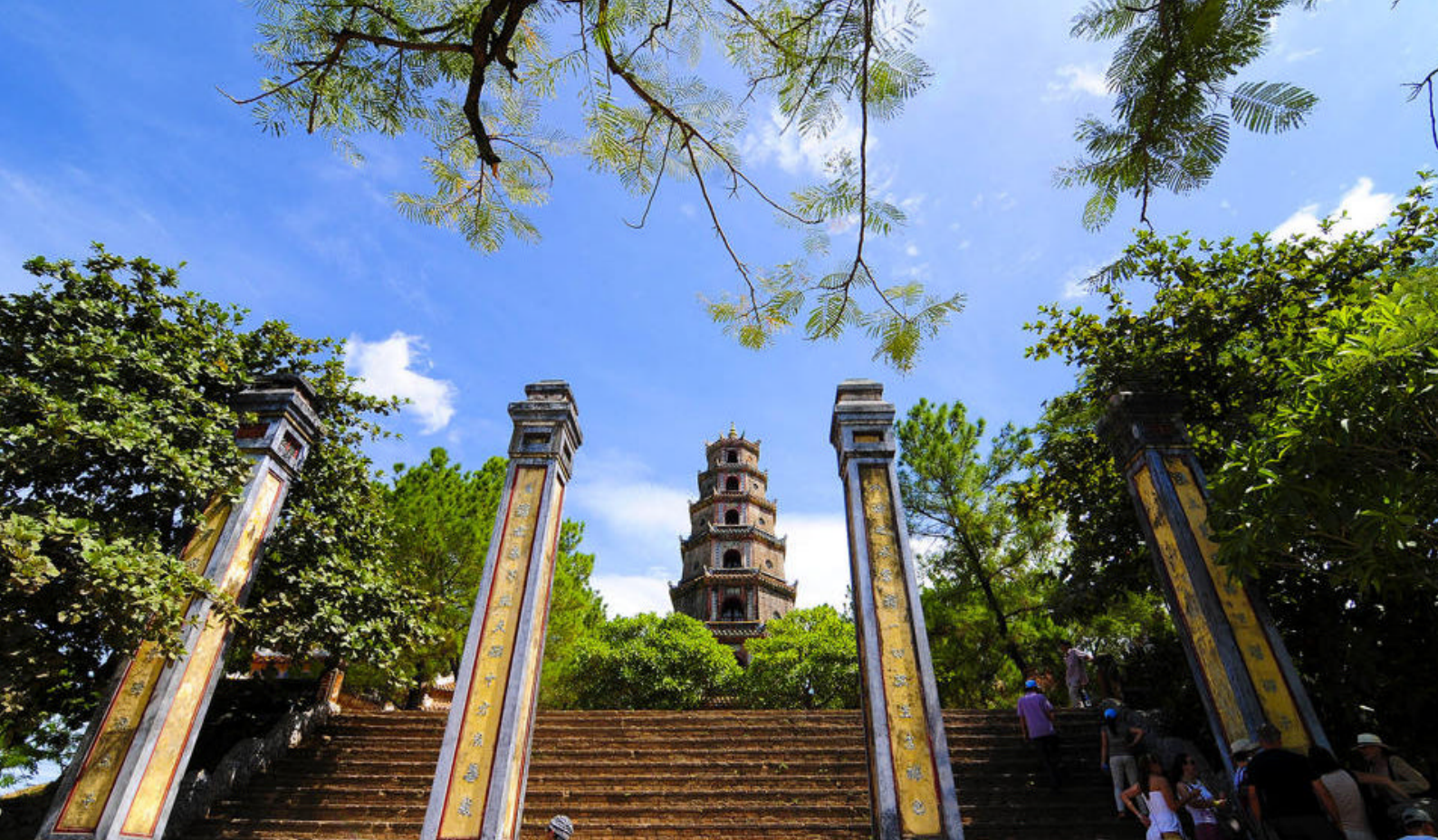
Den berømte Hue Thien Mu pagode i Hué, Vietnam