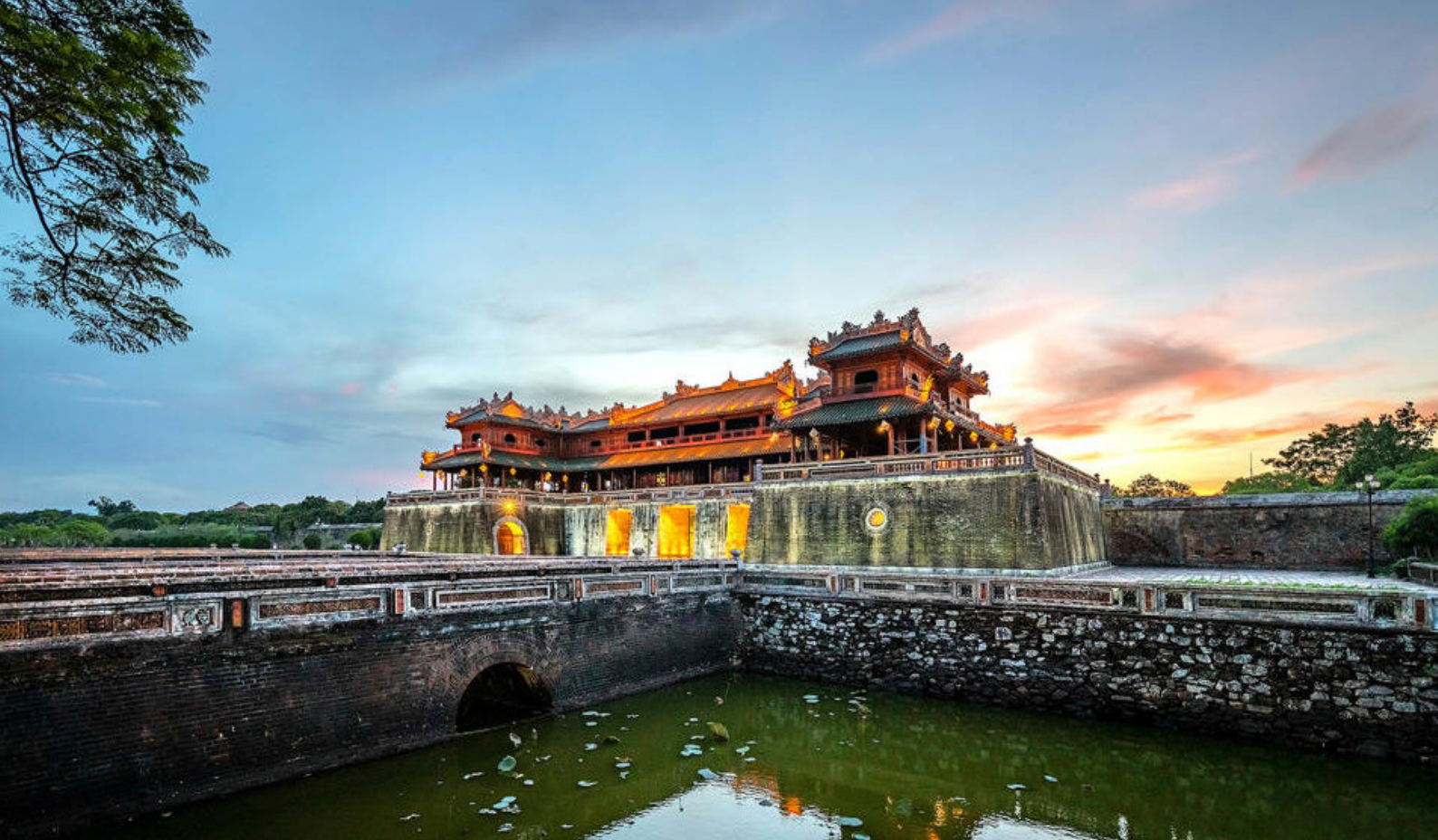
Det gamle keiserpalasset i Hué, Vietnam