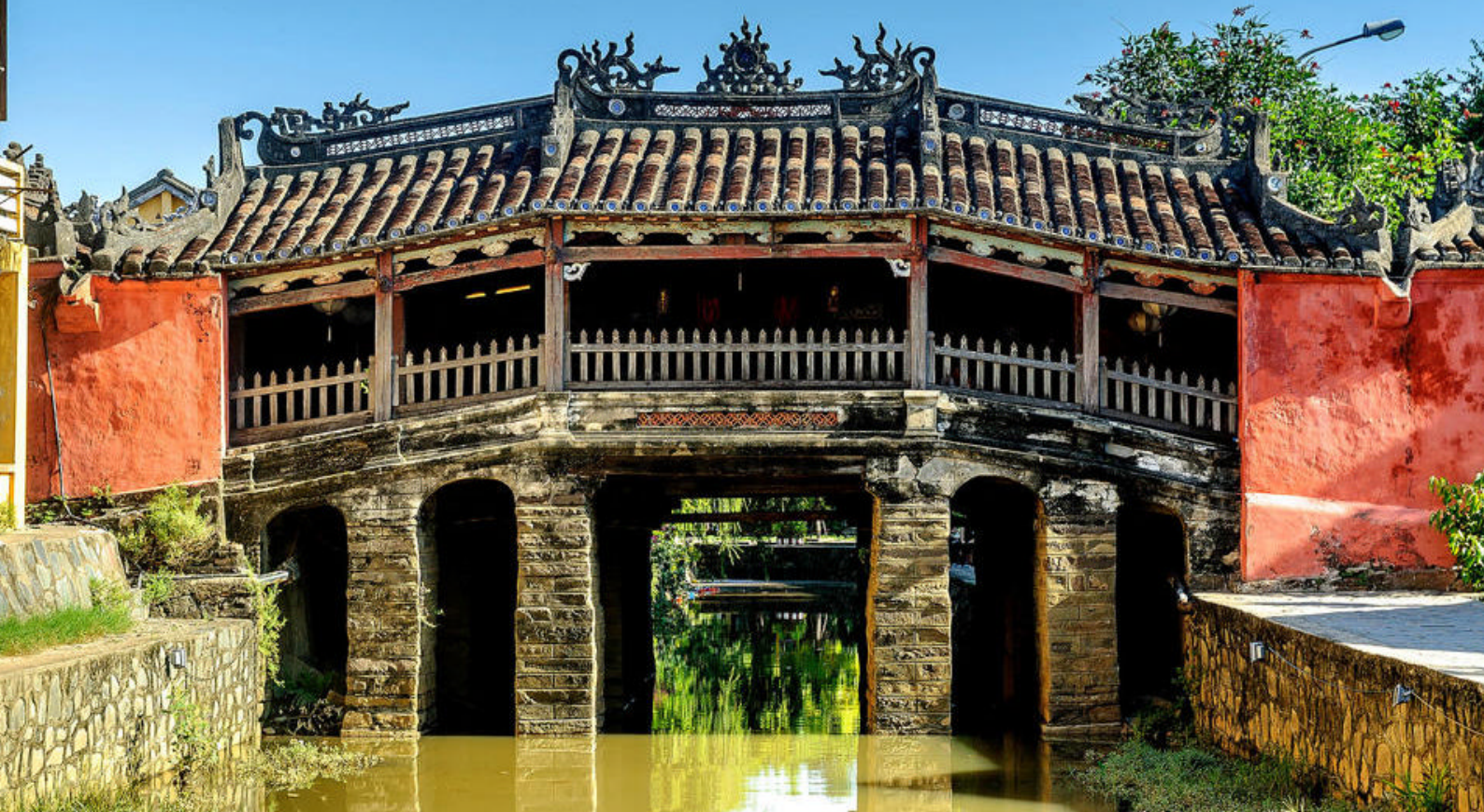
Den gamle japanske broen i Hoi An, Vietnam