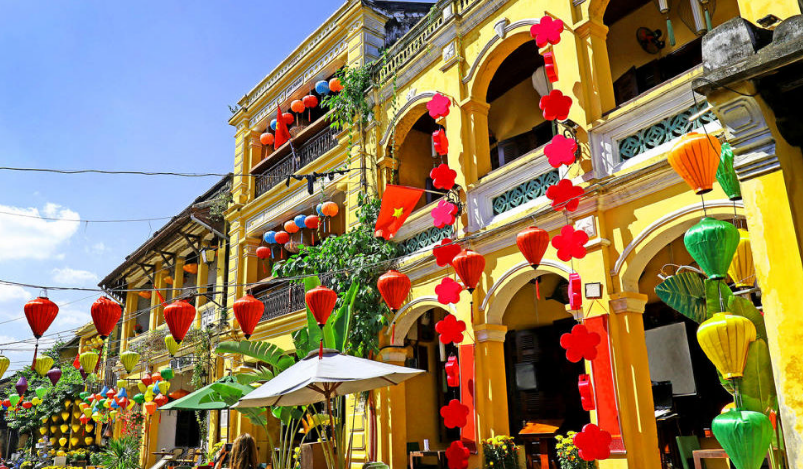
Maleriske Hoi An, Vietnam