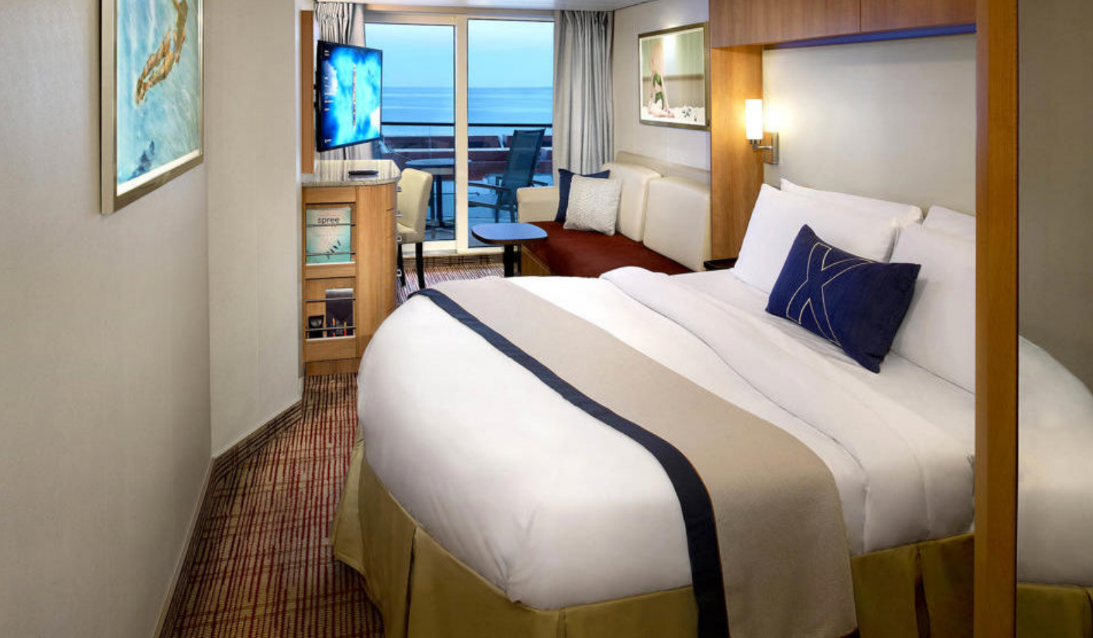
Eksempel på en utvendig lugar på Celebrity Solstice