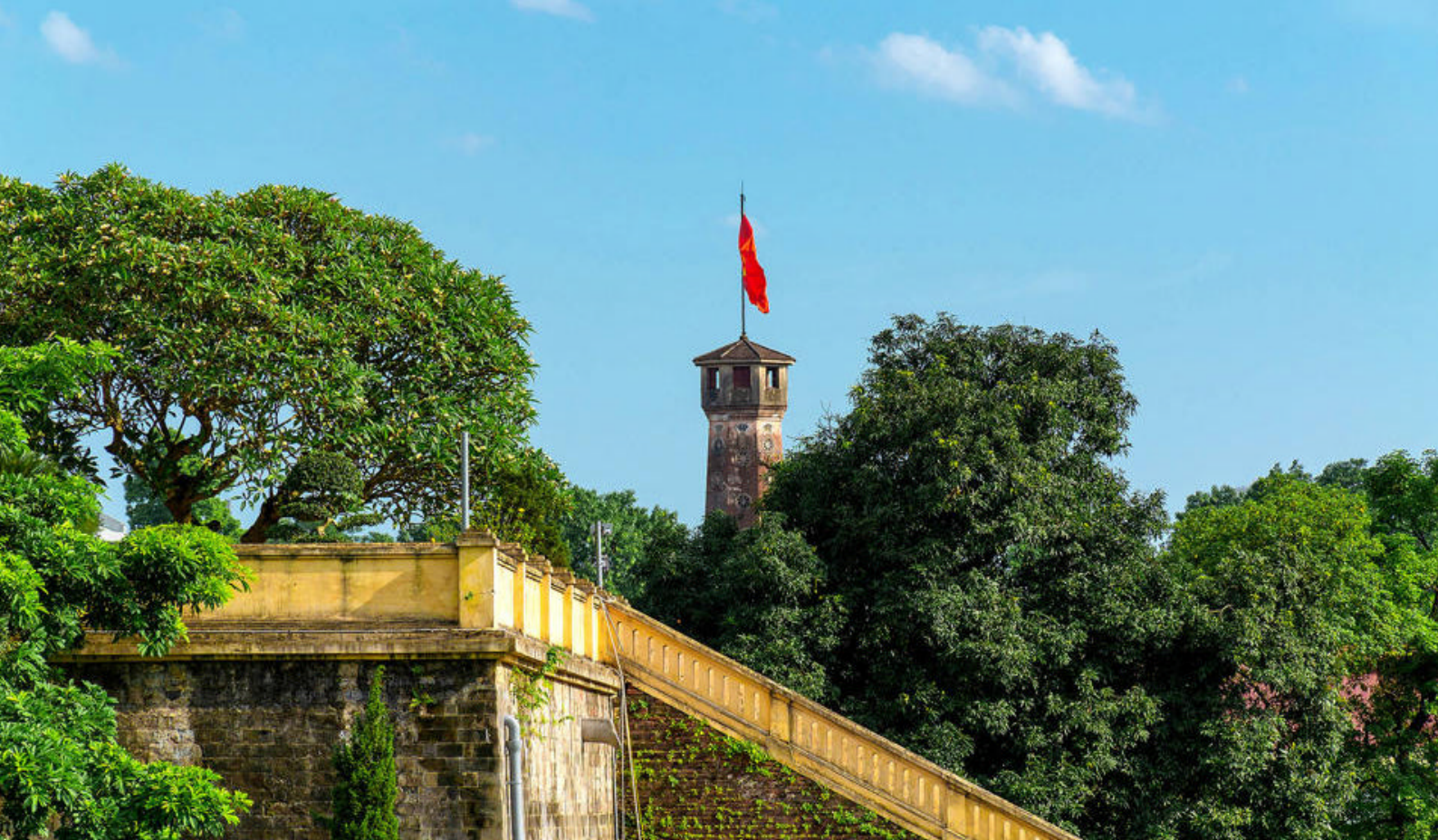
Citadellet i Hanoi, Vietnam

Nyt deres siste dag om bord på Celebrity Solstice. Det er tid til å si farvel til de enestående servitørene, bartenderne og lugar-personalet som har gjort oppholdet ombord ekstra hyggelig med sin service.