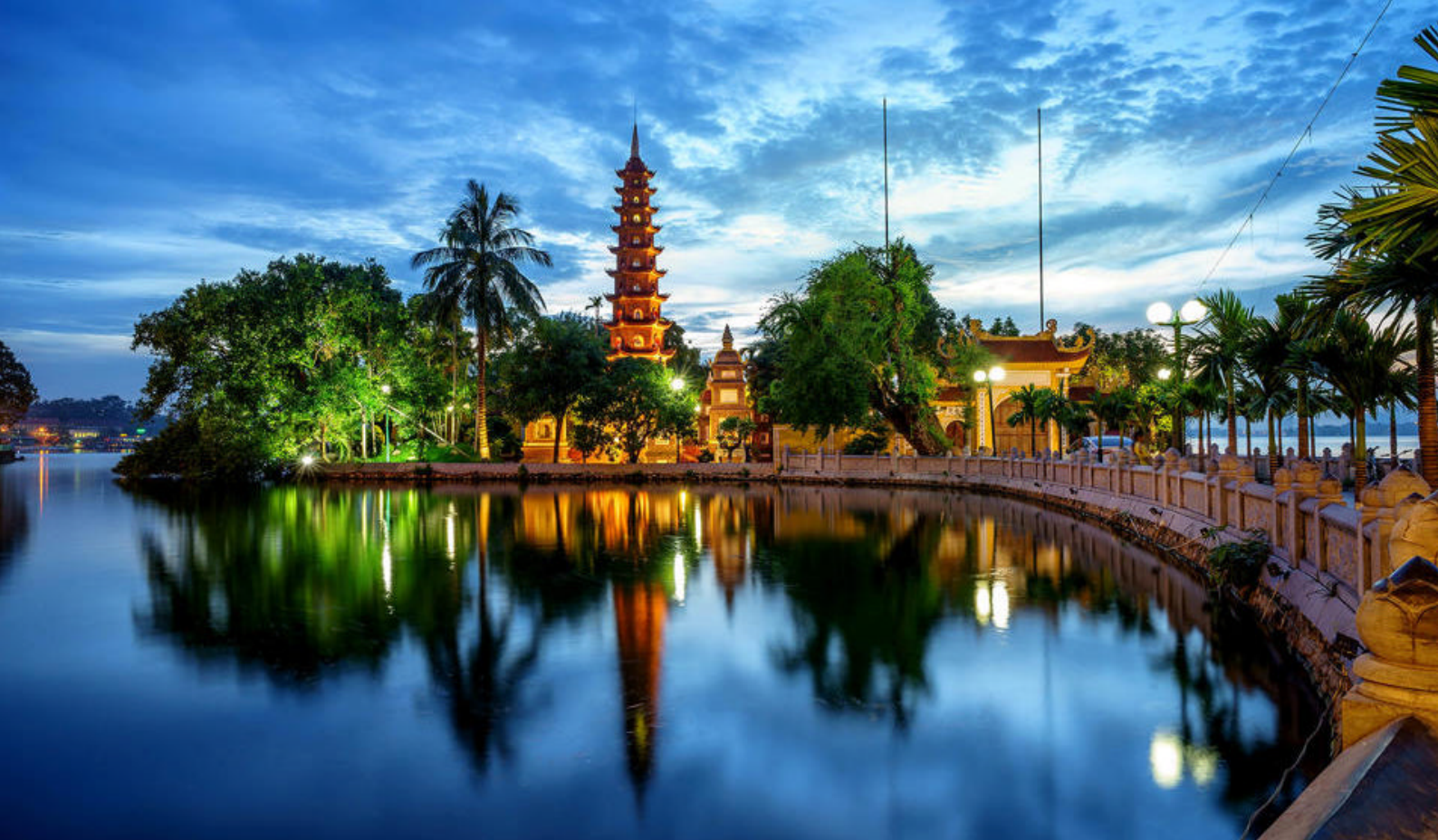
Tran Quoc pagoden i Hanoi, Vietnam

Måltider inkludert: Frokost på skipet samt lunsj og middag på lokale restauranter i Hong Kong Overnatting: På flyet