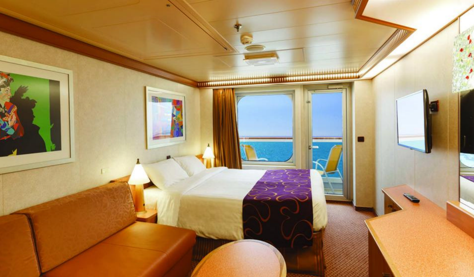
Eksempel på balkonglugar på Costa Diadema

Dag 12: Til sjøs Dag 13: Barcelona, Spania Dag 14: Marseille, Frankrike Dag 15: Savona, Italia