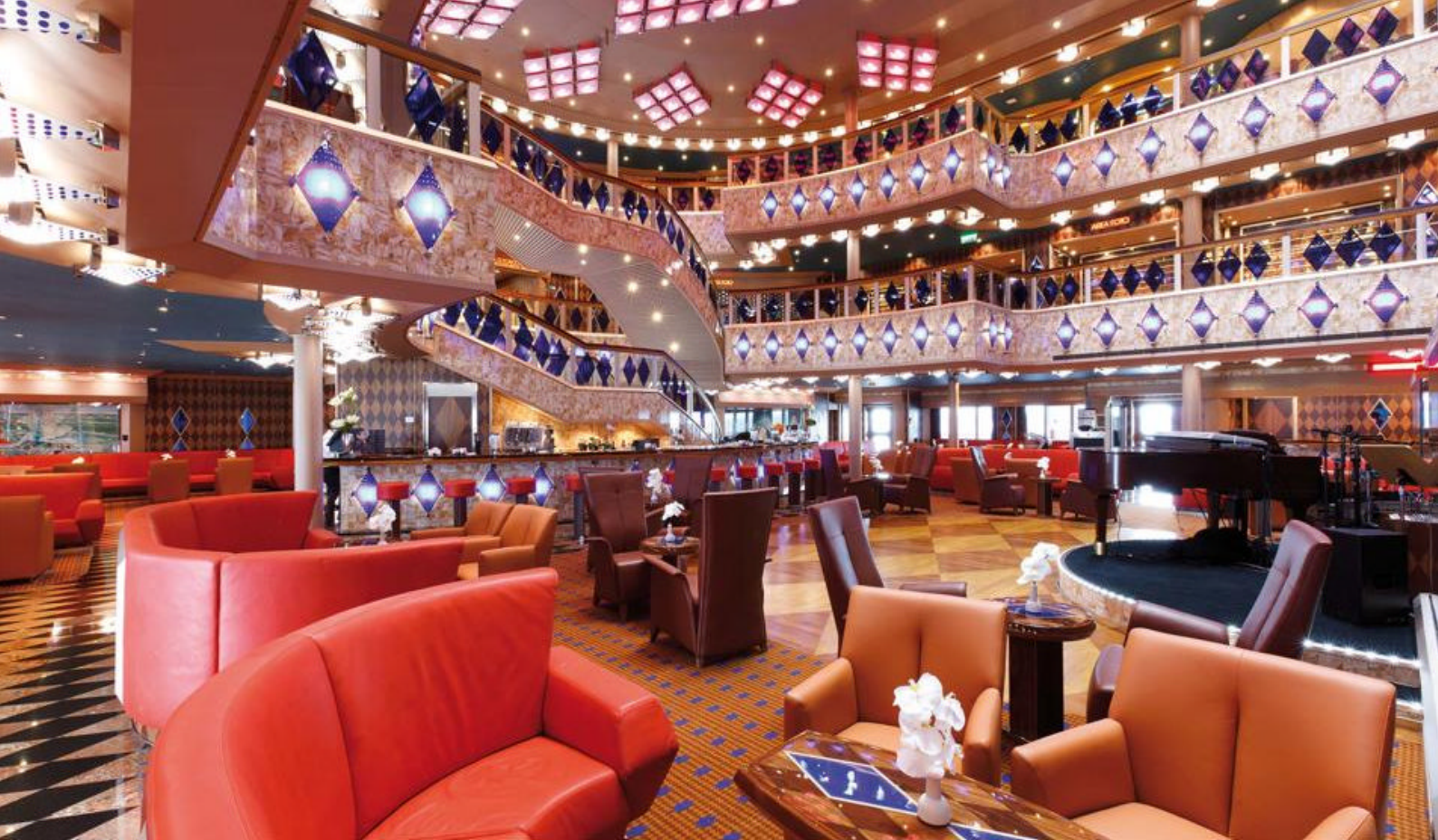
Lobbybar på Costa Favolosa

Dag 7: Santa Cruz de la Palma, La Palma, Spania Dag 8: Funchal, Madeira Dag 9: Til sjøs Dag 10: Gibraltar, britisk oversjøisk territorium Dag 11: Til sjøs Dag 12: Valencia, Spania Dag 13: Barcelona, Spania Dag 14: Marseille, Frankrike Dag 15: Savona, Italia