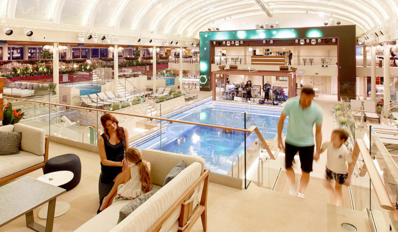
Opplev luksuriøse design og moderne fasiliteter, inkludert flere svømmebasseng, boblebad og avslapningsområder på Costa Smeralda