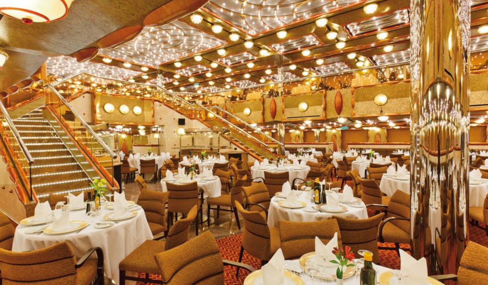
Hovedrestauranten på Costa Favolosa

Dag 3: Malaga, Spania Dag 4: Cadiz, Spania Dag 5: Casablanca, Marokko Dag 6: Casablanca, Marokko Dag 7: Tanger, Marokko Dag 8: Gibraltar Dag 9: Til sjøs Dag 10: Barcelona, Spania Dag 11: Marseille, Frankrike Dag 12: Savona, Italia