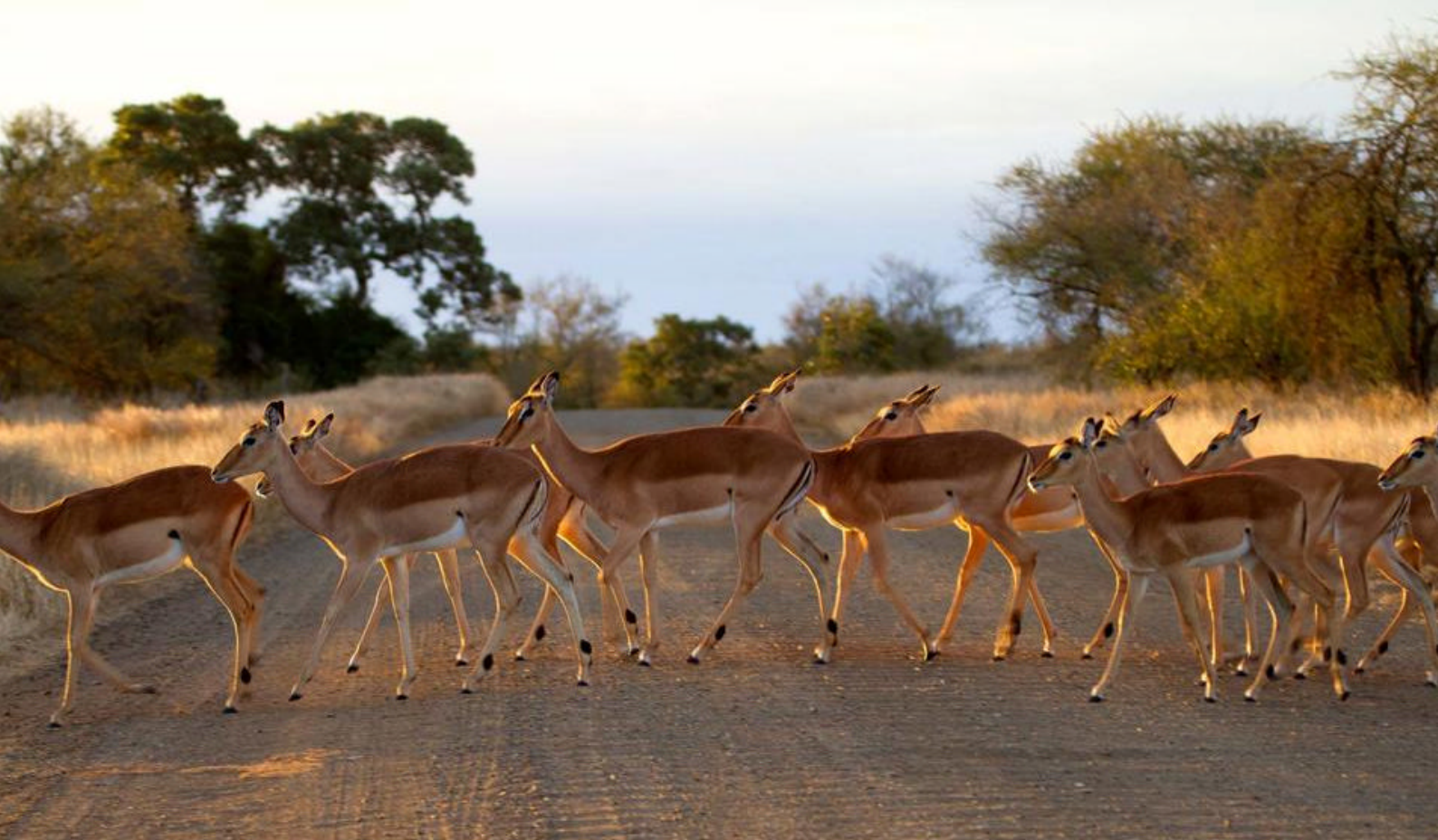
Impalaer på vei over en grusvej i Kruger

store rovdyrene. Høydepunktene er Sunset Dam ved Lower Sabie og piknikområdet Nkuhlu. Stopp og piknikområder mellom Skukuza og Lower Sabie Nkuhlu Picnic Site på H4-1. Butikk og rasteplass.