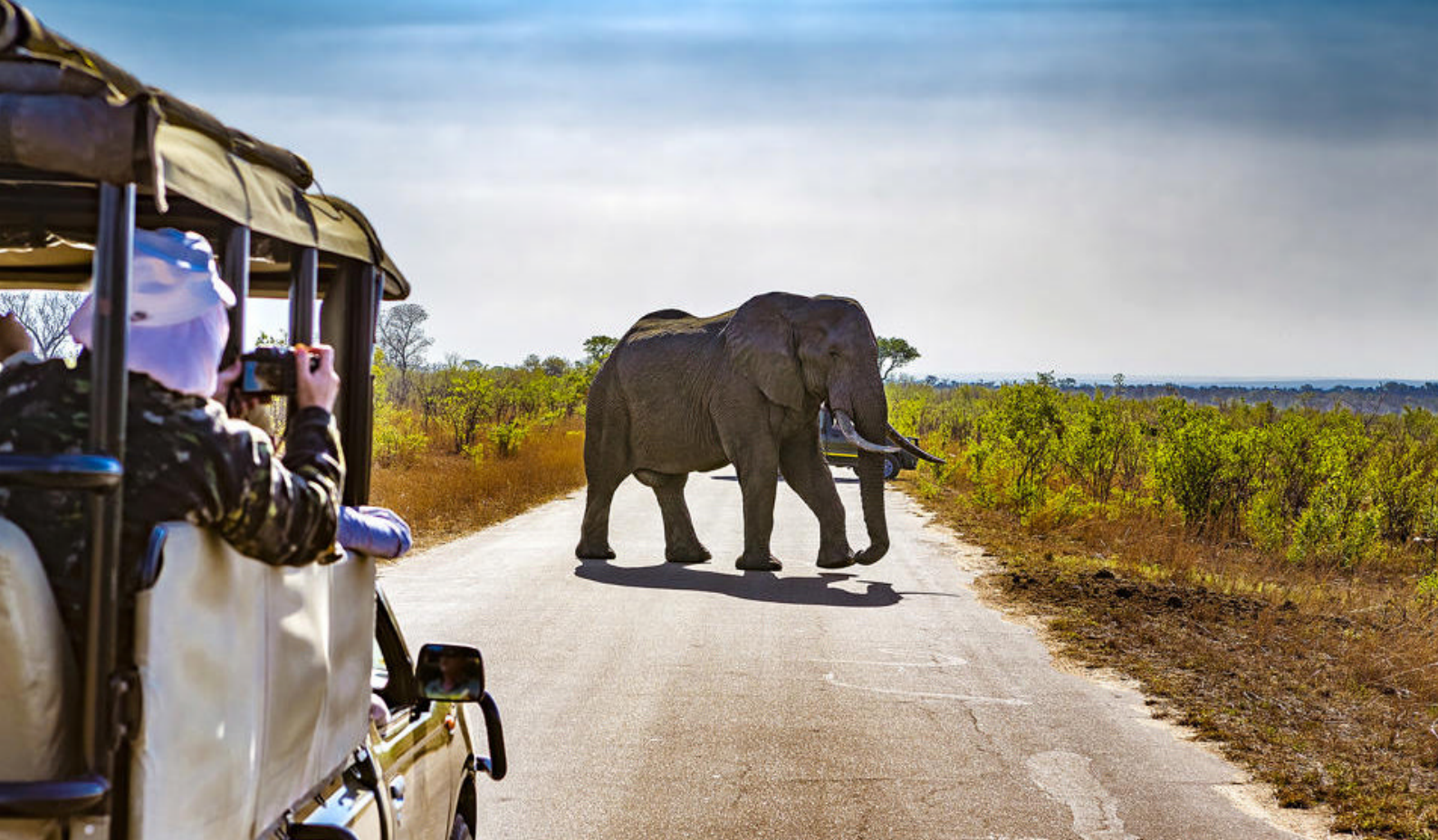
Elefant på asfaltert landevei i Kruger National Park