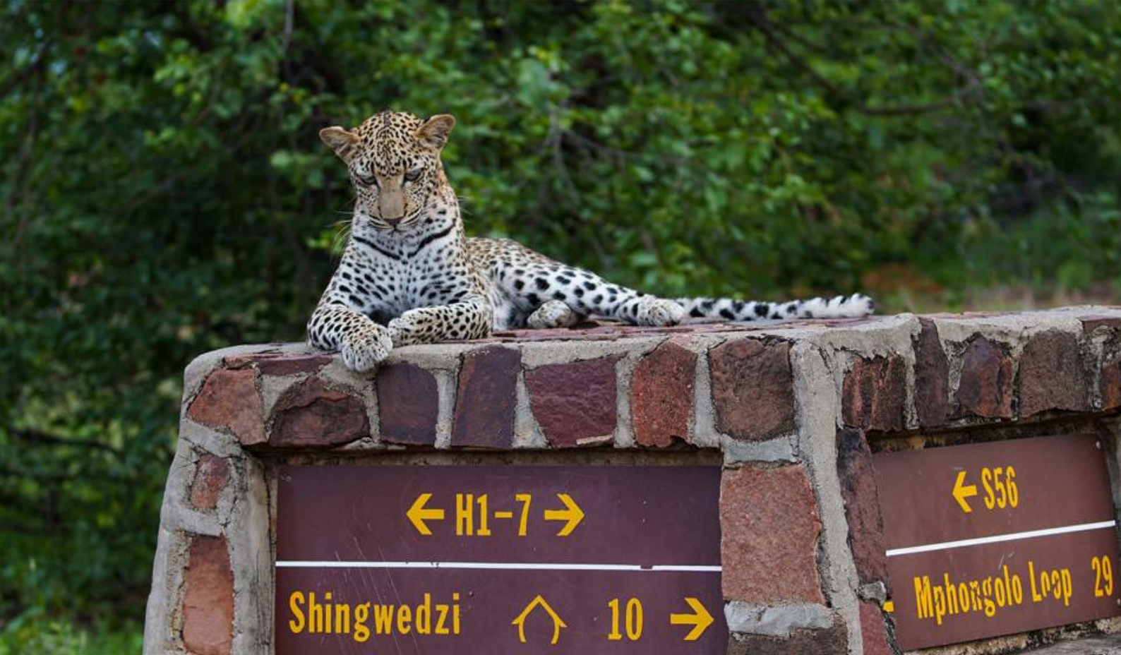
En leopard vokter over et veiskilt i parken