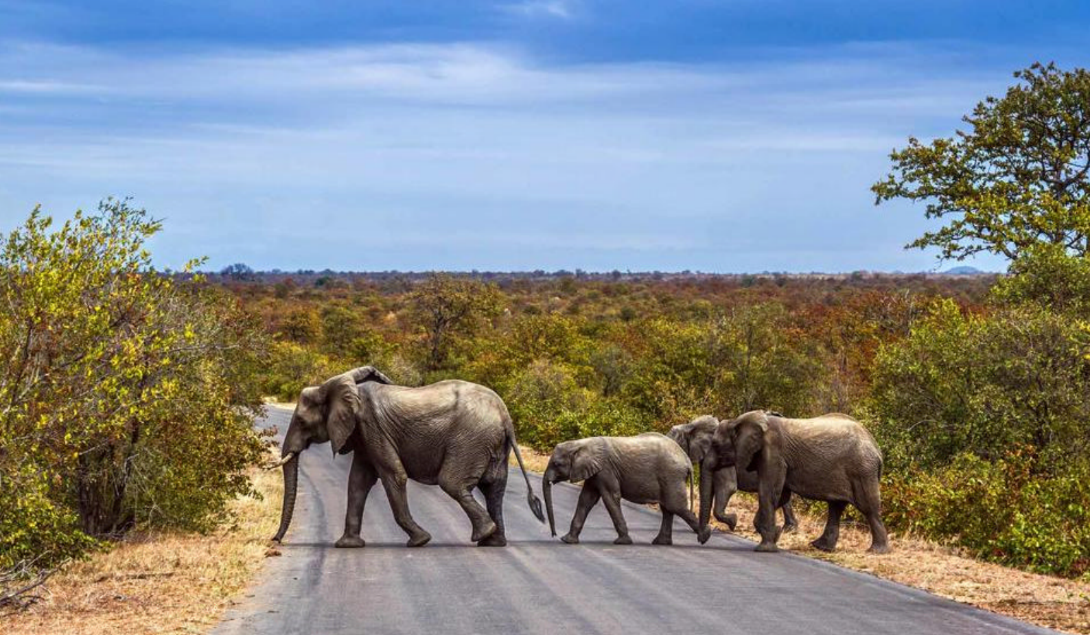
Bush elefanter på vei over asfaltvei i Kruger National Park