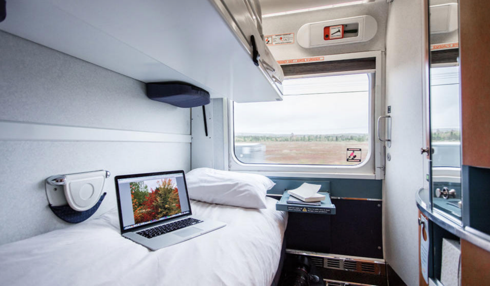
Dere har en overnatting ombord toget

Kupé for 2 personer (Gaspé Peninsula til Quebec City) /Kupéen er et privat rom for 2 personer med toalettfasiliteter og luftkondisjonering. Rommet inneholder komfortable lenestoler på dagtid, som kan gjøres om til over- og underkøye om natten. Det er et lite skap (med plass til 1 stor og 1 liten koffert), en leselampe og en vask med stikkontakt til barbermaskin. Dere har tilgang til dusj bare noen få skritt unna og et gratis dusjsett som inneholder såpe, sjampo, dusjhette, håndkle og vaskeklut.