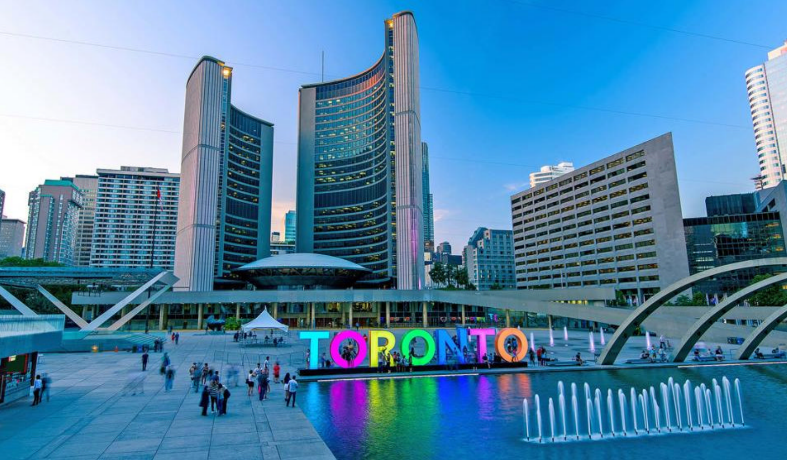
City Hall i Toronto