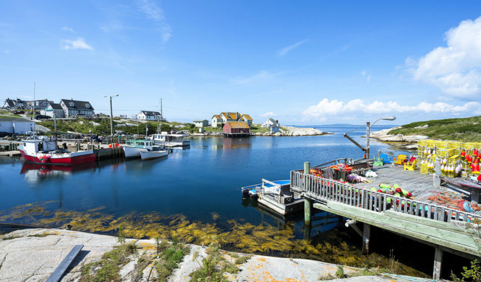
Peggy's Cove i Montreal